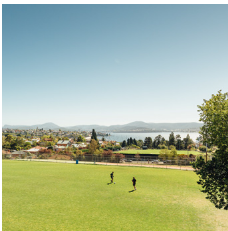
学校操场鸟瞰德文特河

让您的孩子就读男校有诸多好处。我校为男生打造专门的学习环境，提供课业资源和设计课程，以满足男生的学习和成长需求。我们的教师对男子教育充满热情。他们在职业上不断自我提高，摸索适合男子教育的最佳途径。